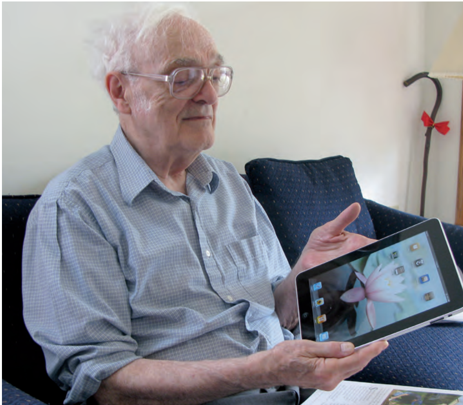
Op grond van het gedrag van de huidige 'jonge senioren' en 'senioren' kunnen we voorspellen dat de vraag naar eenvoudig te bedienen 'high tech' producten zoals de iPad zal toenemen.